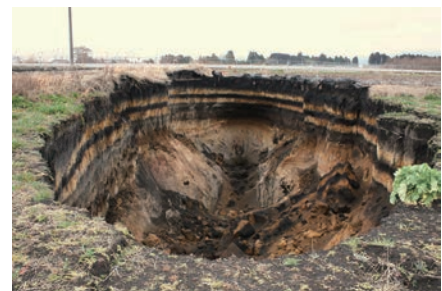
都城畑地の大規模地盤陥没 https://geo.iis.u-tokyo.ac.jp