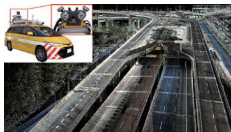
三次元測距レーザーを車載した モバイルマッピングシステム（MMS） によるインフラ形状のサイバー化技術 https://mizutanilab.iis.u-tokyo.ac.jp/